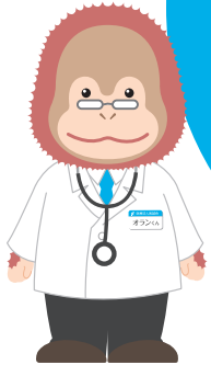
イメージキャラクター オランくん