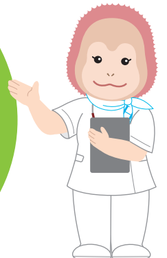
イメージキャラクター ウータンちゃん